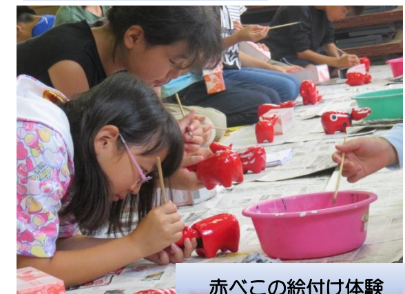
赤べこの絵付け体験