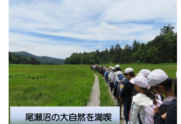
尾瀬沼の大自然を満喫