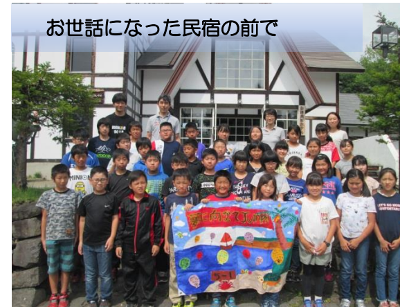
お世話になった民宿の前で