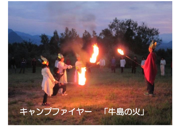
キャンプファイヤー 「牛島の火」